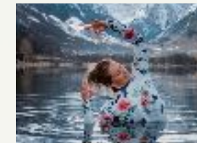
Posture en torsion