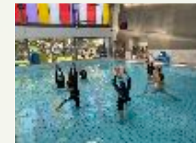
Aqua yoga santé

Les devoirs requièrent un moyen vidéo pour retransmettre les séances pratiques d'aqua yoga.