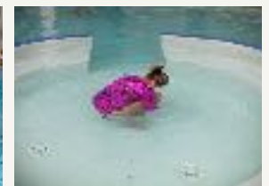
Posture en immersion