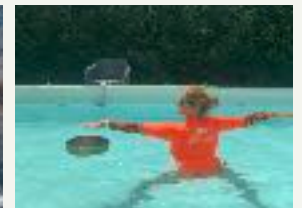
Posture pieds au sol